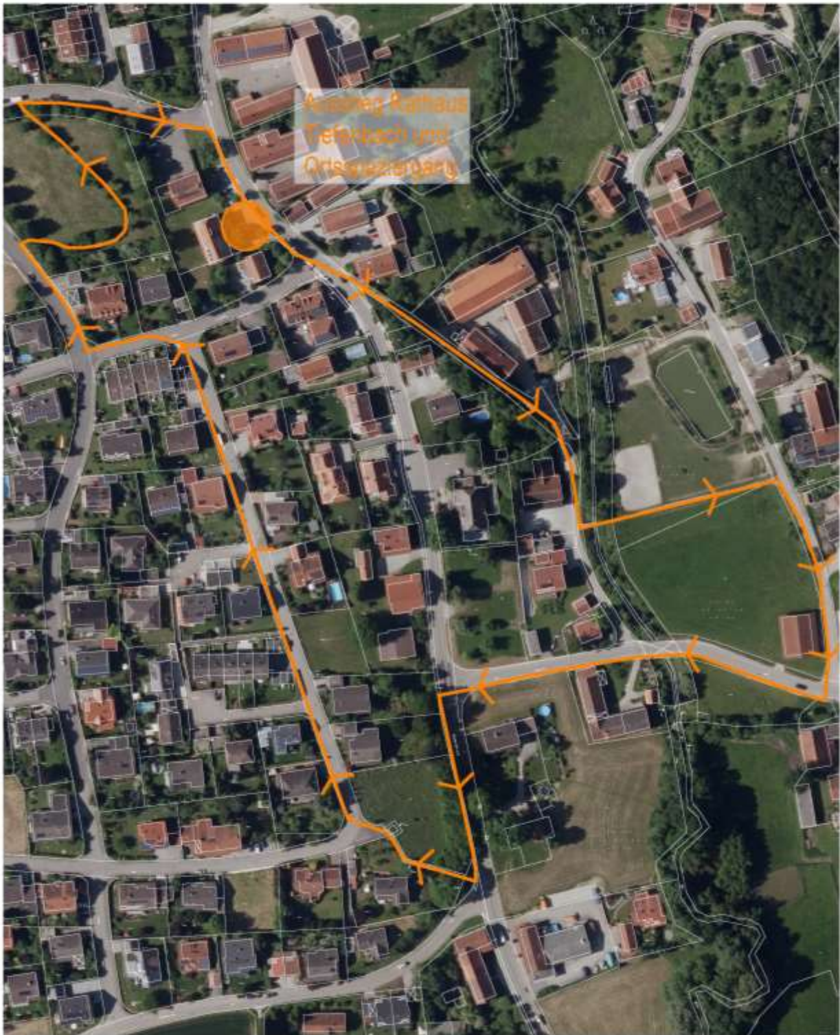
IOEK TIEFENBACH - Ortsbegehung am 16.09.2015