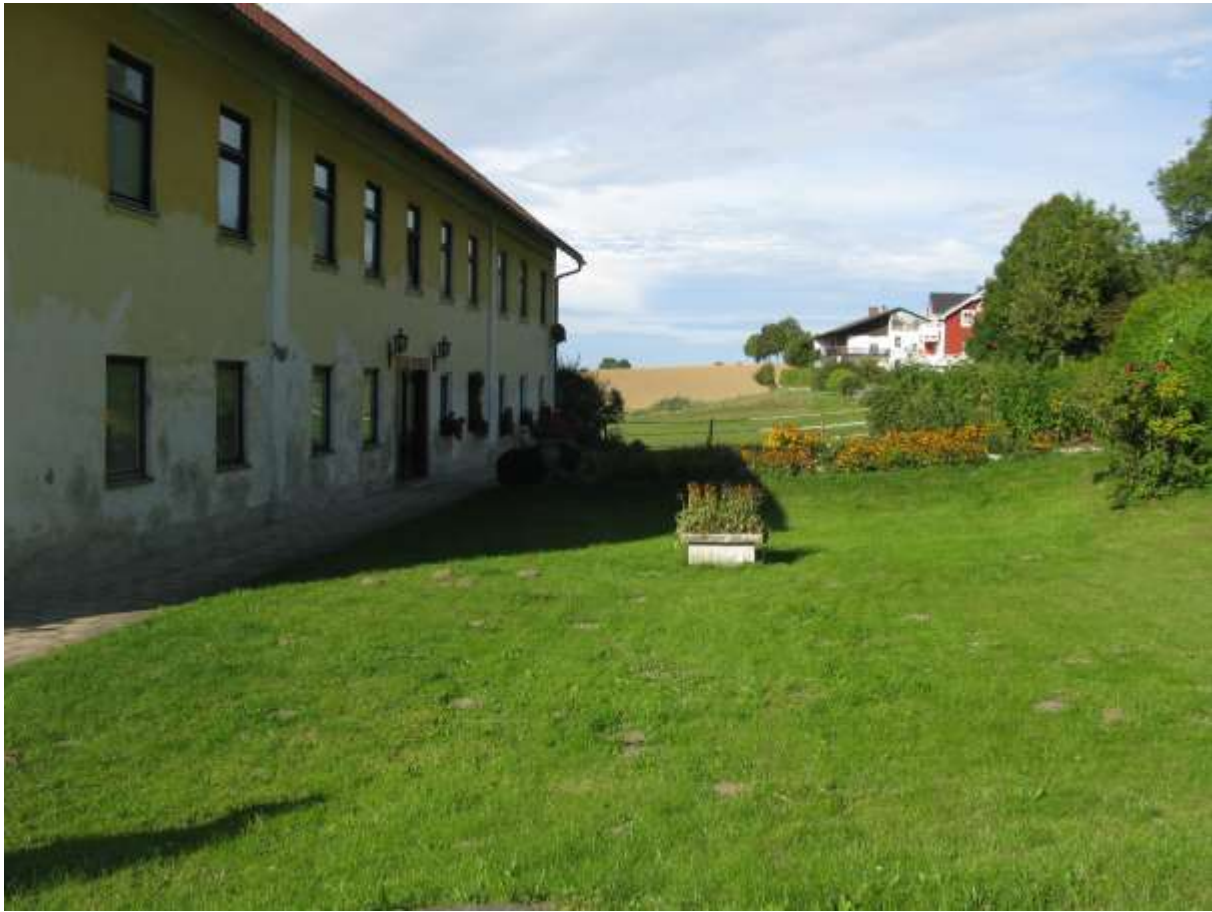
Rundgang Badhaus Ast