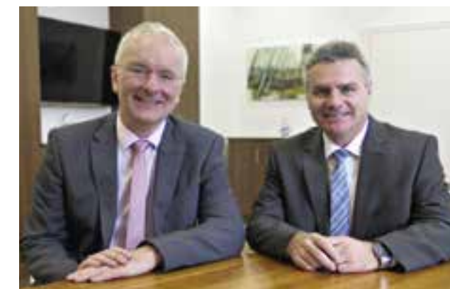
Alexander Putz Oberbürgermeister der Stadt Landshut

Wir wünschen Ihnen viel Freude bei der Lektüre des Wegweisers!