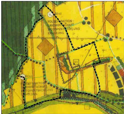
FNP/LP – Bestand

Die Gemeinde Tiefenbach hat einen rechtswirksamen Flächennutzungsplan (FNP) und Landschaftsplan (LP) vom 11.05.1999. Der betreffende Bereich wird darin gegenwärtig als landwirtschaftliche Nutzfläche dargestellt. Es ist daher die Fortschreibung des FNP/LP durch Deckblatt Nr. 22 im Parallelverfahren erforderlich.