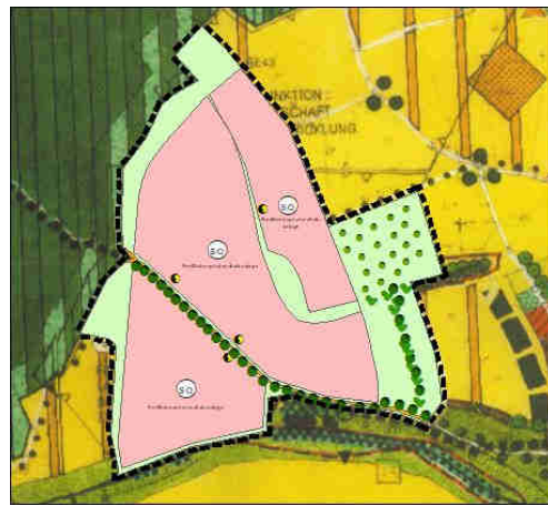
FNP/LP – Fortschreibung

Der Gemeinde Tiefenbach ist der Grundsatz des sparsamen Umgangs mit Grund und Boden und der daraus resultierenden Verantwortung sehr wohl bewusst, auch im Hinblick darauf, landwirtschaftliche Nutzflächen für bauliche Zwecke in Anspruch zu nehmen. Andererseits aber hat sie den Zielsetzungen der übergeordneten Raum- und Landesplanung Rechnung zu tragen, indem sie die regenerativen Energiequellen fördert und damit einen wichtigen Beitrag zum Klimaschutz leistet.